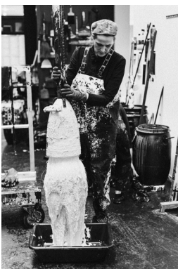
Fabienne Verdier dans son atelier

L'exposition sera accompagnée d'un espace pédagogique pour enfants et adultes, d'une offre de médiation destinée à tous les publics et de la publication d'un catalogue.