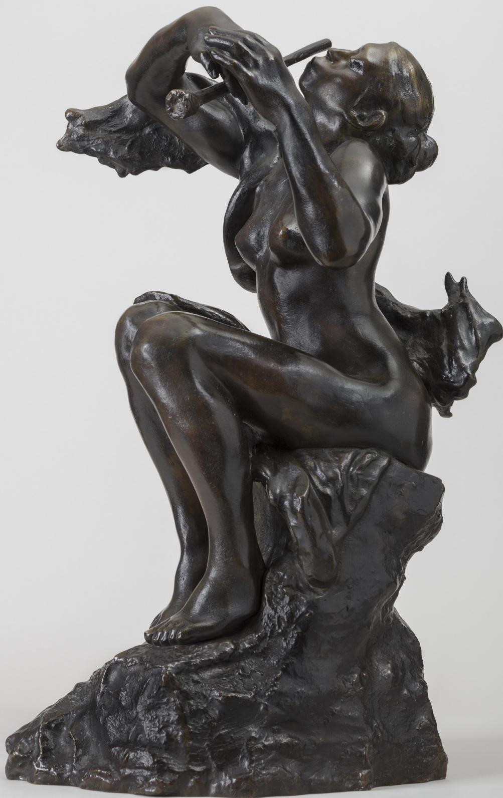
Camille Claudel, La Joueuse de flûte , vers 1905, bronze