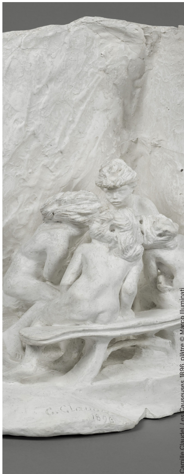
Camille Claudel, Les Causeuses, 1896, plâtre