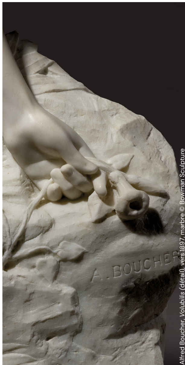
Alfred Boucher, Volubilis (détail), vers 1897, marbre © Bowman Sculpture

Visite sur le processus de création d'une sculpture. Réalisation d'une esquisse avec de la cire, matériau malléable.