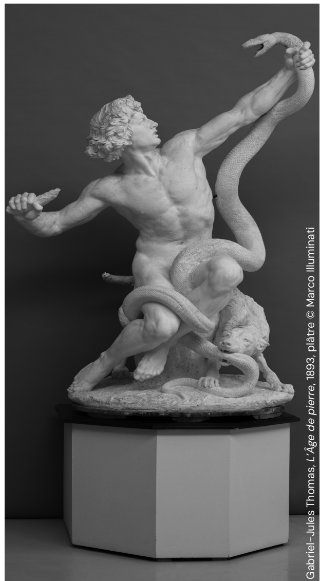
Gabriel-Jules Thomas, L'Âge de pierre , 1893, plâtre

Orphée, Narcisse, ou encore Persée sont présents dans des œuvres du musée. Observation de sculptures inspirées de la mythologie.