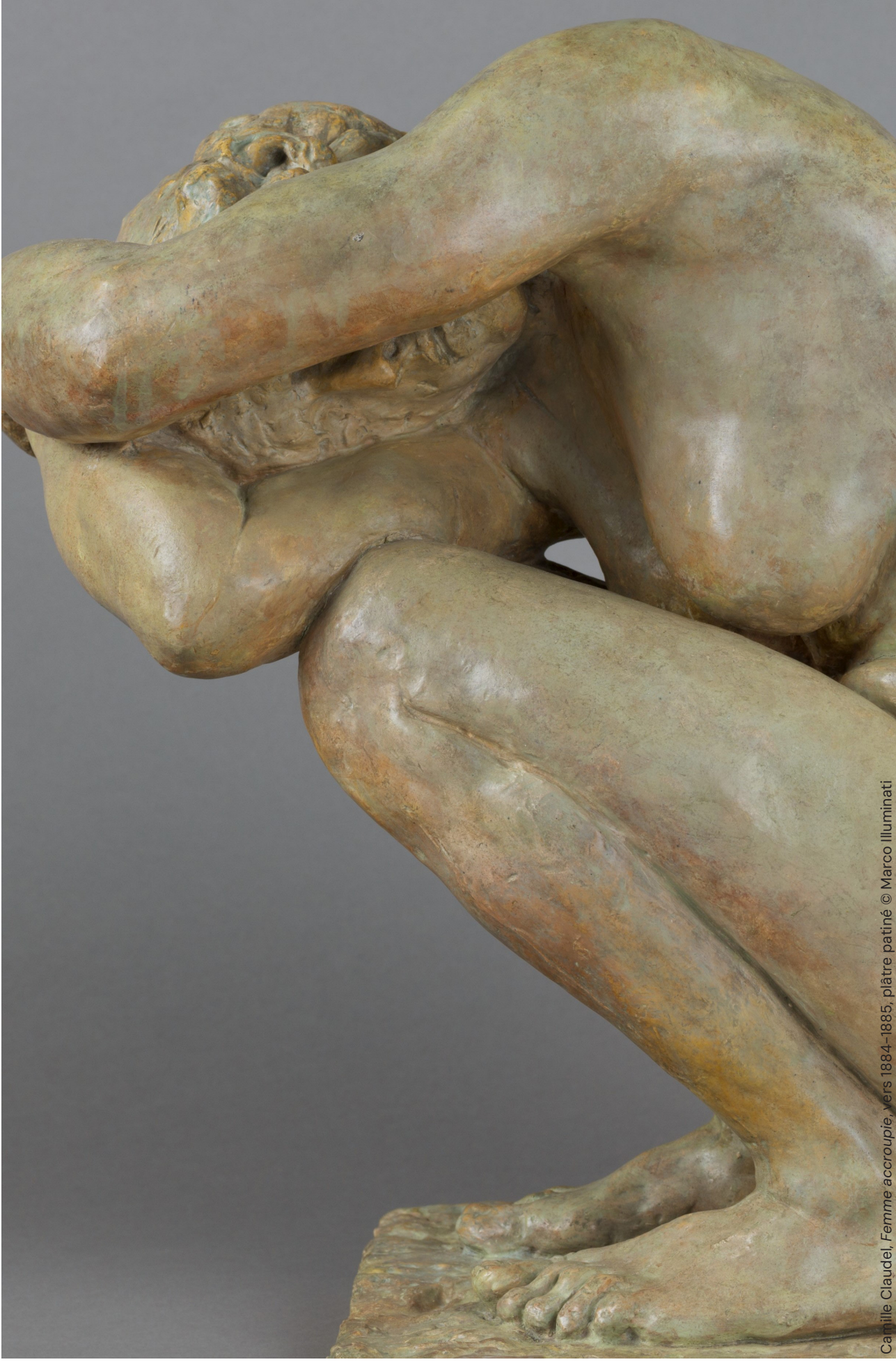
Camille Claudel, Femme accroupie, vers 1884-1885, plâtre patiné