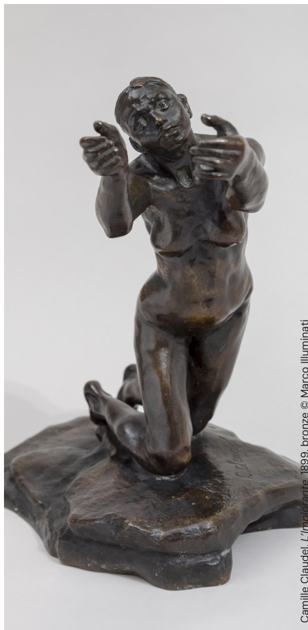
Camille Claudel, L'implorante , 1899, bronze © Marco Illuminati

L'observation d'œuvres montre l'importance du modèle au XIX e siècle et son rôle dans le processus de création. L'atelier permet aux élèves de s'essayer au modelage d'après modèle vivant face à des élèves volontaires qui posent tour à tour.