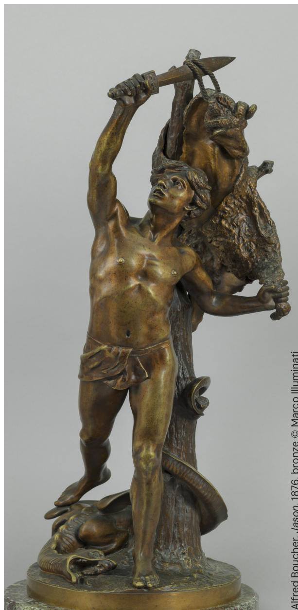
Alfred Boucher, Jason , 1876, bronze

Comment Camille Claudel arrive-t-elle à générer tant d'émotions avec des œuvres telles que L'Âge mûr , Les Causeuses ou encore La Valse ? La visite interroge à la fois les moyens utilisés pour exprimer des émotions, mais aussi le ressenti de l'observateur.